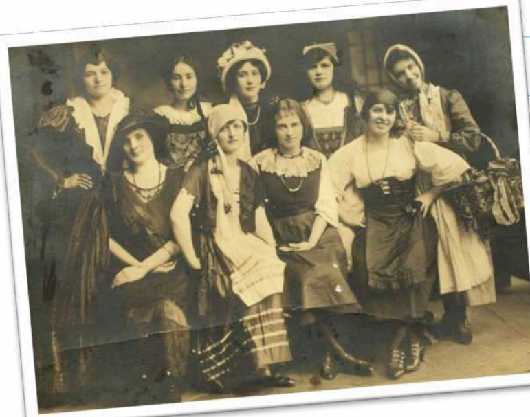
1922. New York. Dames Valdôtaines en costume du Pays.